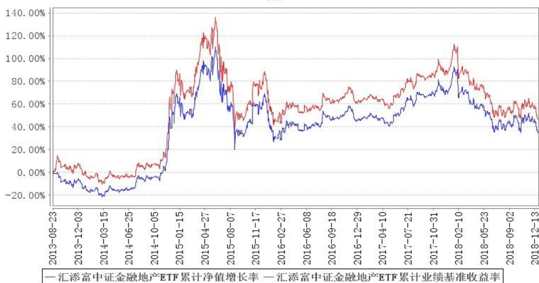
汇添富中证金融地产ETF累计净值增长率与同期业绩比较基准收益率的历史走势对比图

注:本基金建仓期为本《基金合同》生效之日(2013年8月23日)起3个月,建仓结束时各项资产配置比例符合合同约定。