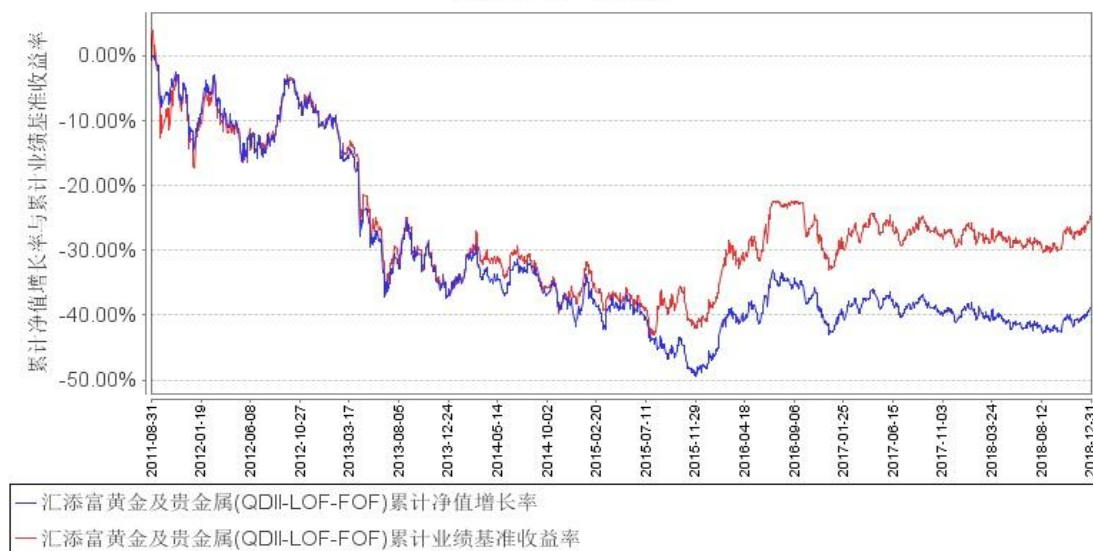
汇添富黄金及贵金属(QDII-LOF-FOF)累计净值增长率与同期业绩比较基准收益率的历史走势对比图

注：本基金建仓期为本《基金合同》生效之日（2011年8月31日）起6个月，建仓结束时各项资产配置比例符合合同规定。