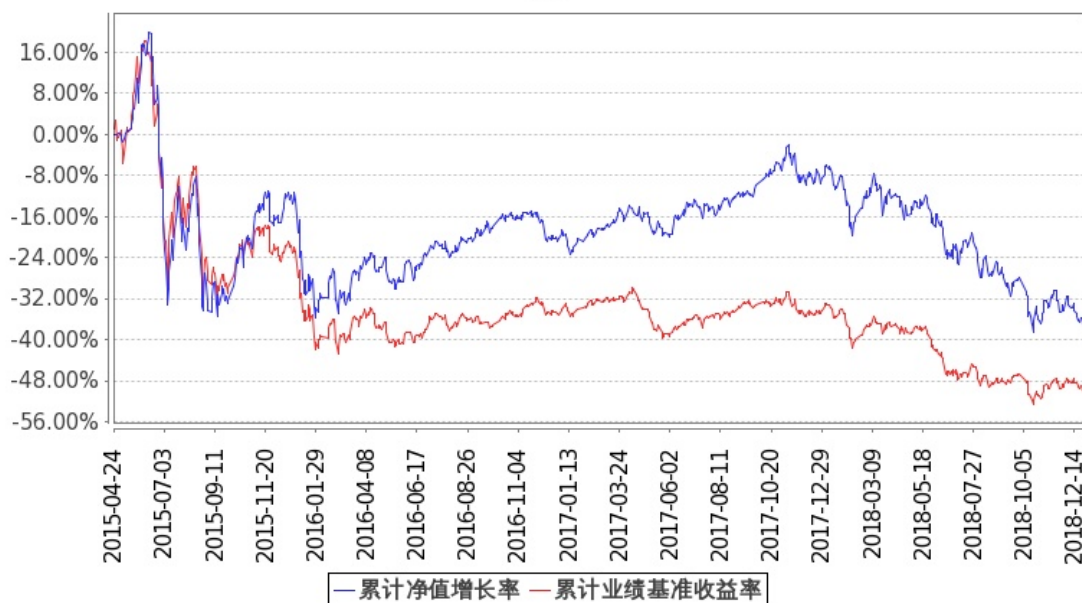
图：嘉实先进制造股票基金份额累计净值增长率与同期业绩比较基准收益率的历史走势对比图 (2015 年 4 月 24 日至 2018 年 12 月 31 日)

注：按基金合同和招募说明书的约定，本基金自基金合同生效日起 6 个月内为建仓期，建仓期结束时本基金的各项投资比例符合基金合同（十二（二）投资范围和（四）投资限制）的有关约定。