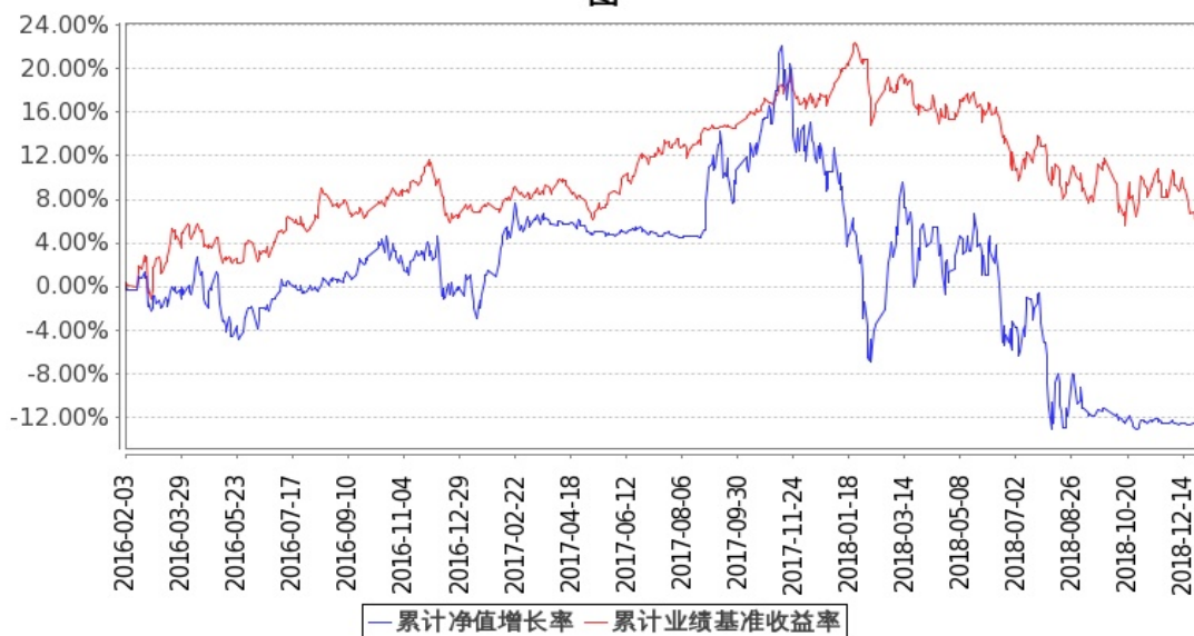
图：嘉实创新成长混合基金累计份额净值增长率与同期业绩比较基准收益率的历史走势对比图 (2016年2月3日至2018年12月31日)

注:1: 按基金合同和招募说明书的约定, 本基金自基金合同生效日起6个月内为建仓期, 建仓期结束时本基金的各项投资比例符合基金合同(十二(二)投资范围和(四)投资限制)的有关约定。