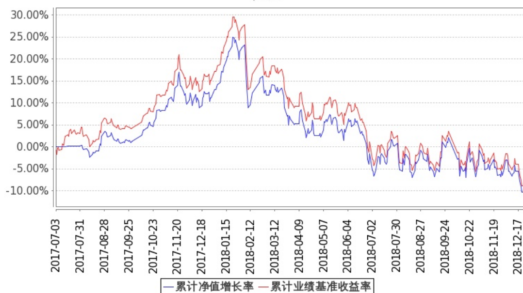
图：嘉实富时中国 A50ETF 基金份额累计净值增长率与同期业绩比较基准收益率的历史走势对比图