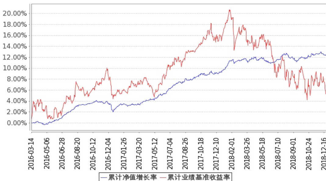
嘉实新起航混合累计净值增长率与同期业绩比较基准收益率的历史走势对比图

图: 嘉实新起航混合基金份额累计净值增长率与同期业绩比较基准收益率的历史走势对比图