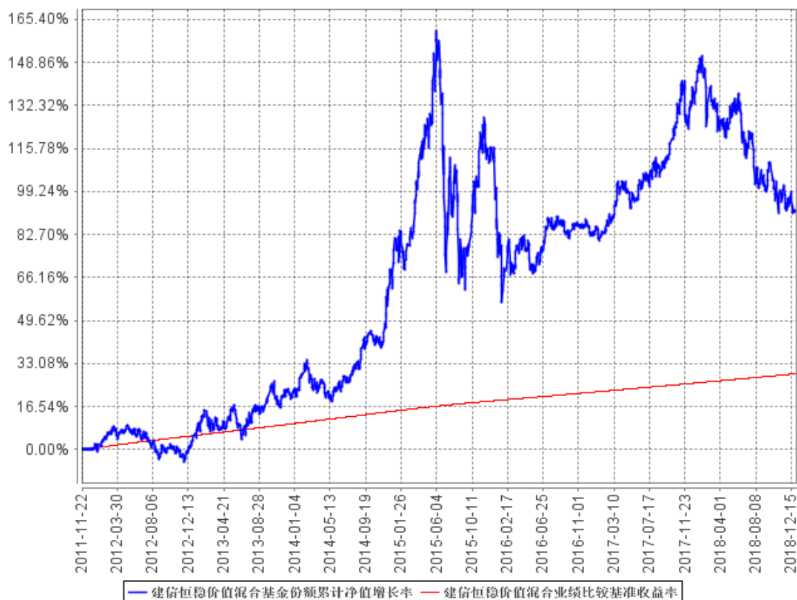
建信恒稳价值混合基金份额累计净值增长率与同期业绩比较基准收益率的历史走势对比图