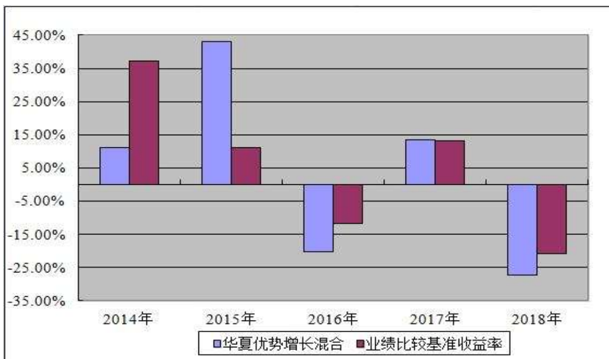
基金每年净值增长率及其与同期业绩比较基准收益率的对比图