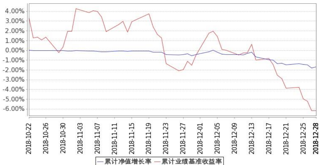
图 1：嘉实资源精选股票 A 基金份额累计净值增长率与同期业绩比较基准收益率的历史走势对比图