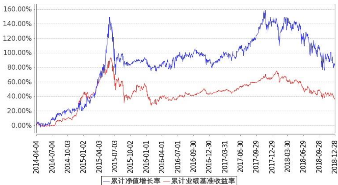
图：嘉实泰和混合基金份额累计净值增长率与同期业绩比较基准收益率的历史走势对比图