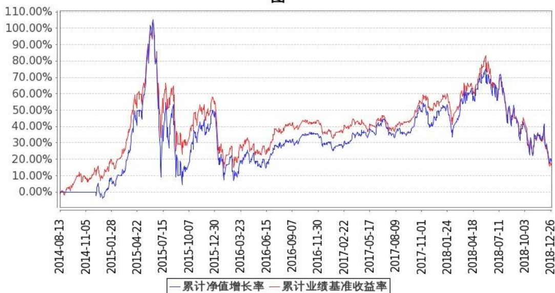
图：嘉实医疗保健股票基金份额累计净值增长率与同期业绩比较基准收益率的历史走势对比图 (2014年8月13日至2018年12月31日)

注：按基金合同和招募说明书的约定，本基金自基金合同生效日起6个月内为建仓期，建仓期结束时本基金的各项投资比例符合基金合同（十二（二）投资范围和（四）投资限制）的有关约定。