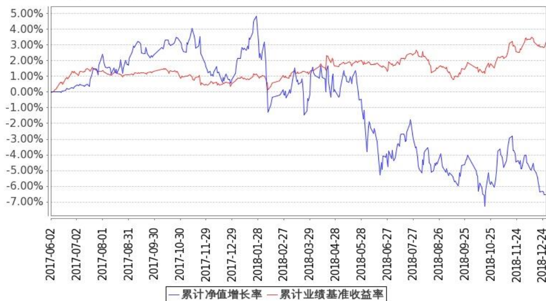
图 1：嘉实稳宏债券 A 基金份额累计净值增长率与同期业绩比较基准收益率的历史走势对比图