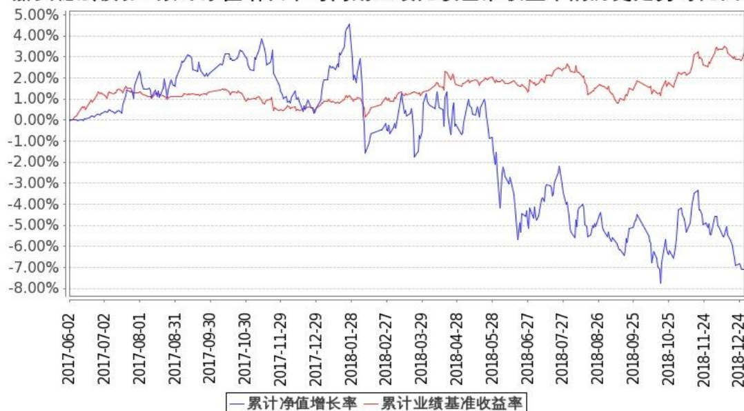
图 2：嘉实稳宏债券 C 基金份额累计净值增长率与同期业绩比较基准收益率的历史走势对比图