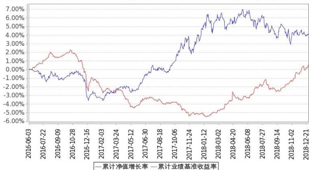
图：嘉实稳盛债券基金份额累计净值增长率与同期业绩比较基准收益率的历史走势对比图