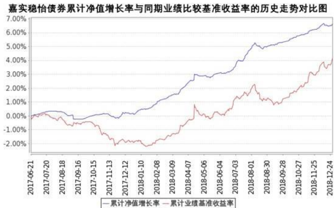
图：嘉实稳怡债券基金份额累计净值增长率与同期业绩比较基准收益率的历史走势对比图