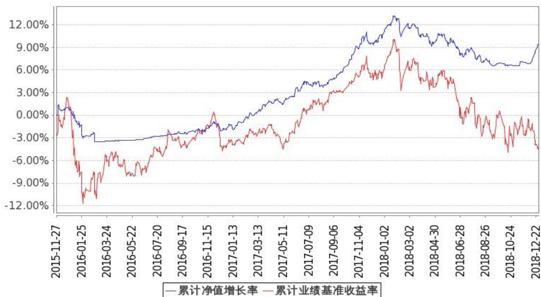
图1：嘉实新起点混合 A 基金份额累计净值增长率与同期业绩比较基准收益率的历史走势对比图