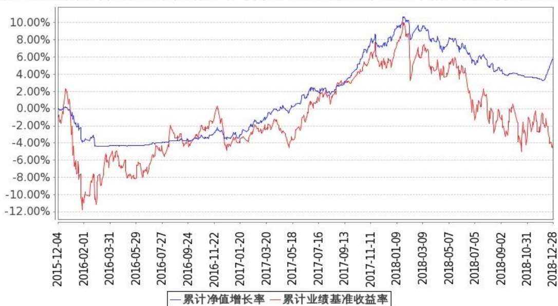
图2：嘉实新起点混合 C 基金份额累计净值增长率与同期业绩比较基准收益率的历史走势对比图