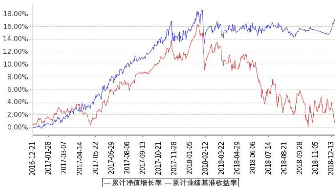
图：嘉实新添瑞混合基金份额累计净值增长率与同期业绩比较基准收益率的历史走势对比图