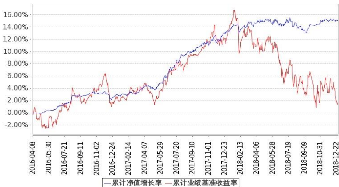
图：嘉实新趋势混合基金份额累计净值增长率与同期业绩比较基准收益率的历史走势对比图