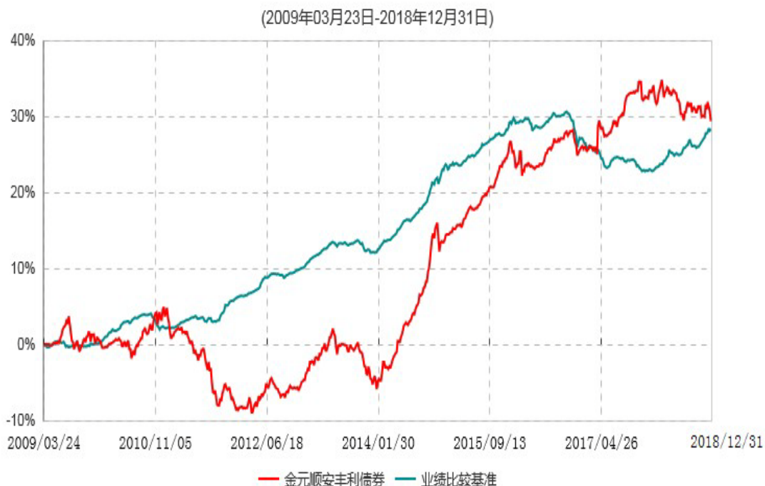
金元顺安丰利债券型证券投资基金累计净值增长率与业绩比较基准收益率历史走势对比图