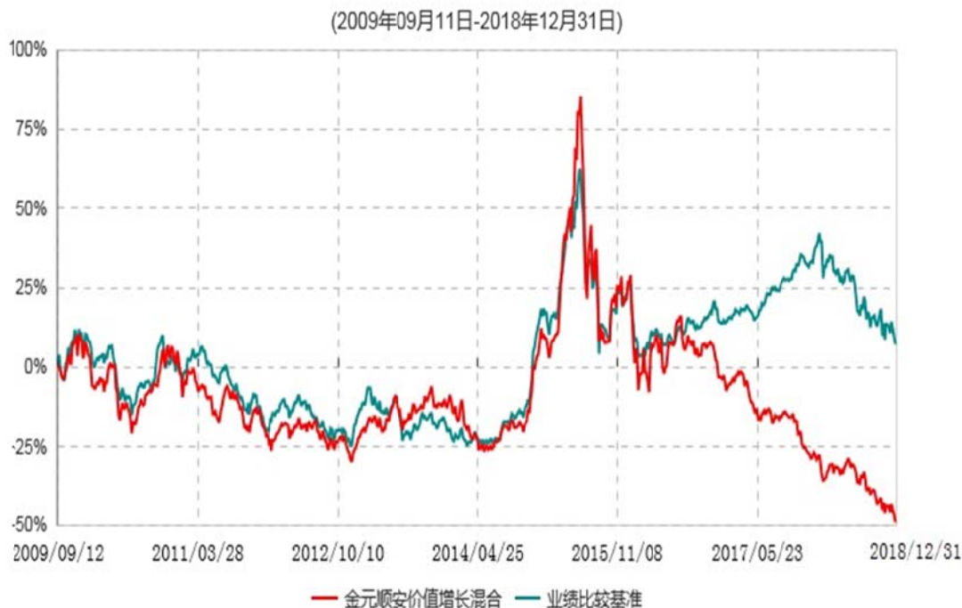
金元顺安价值增长混合型证券投资基金累计净值增长率与业绩比较基准收益率历史走势对比图