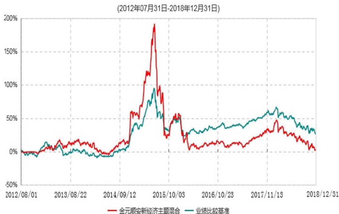
金元顺安新经济主题混合型证券投资基金累计净值增长率与业绩比较基准收益率历史走势对比图