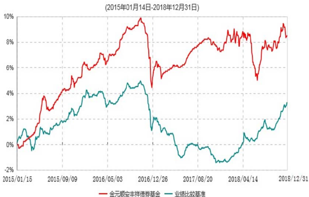
金元顺安丰祥债券型证券投资基金累计净值增长率与业绩比较基准收益率历史走势对比图