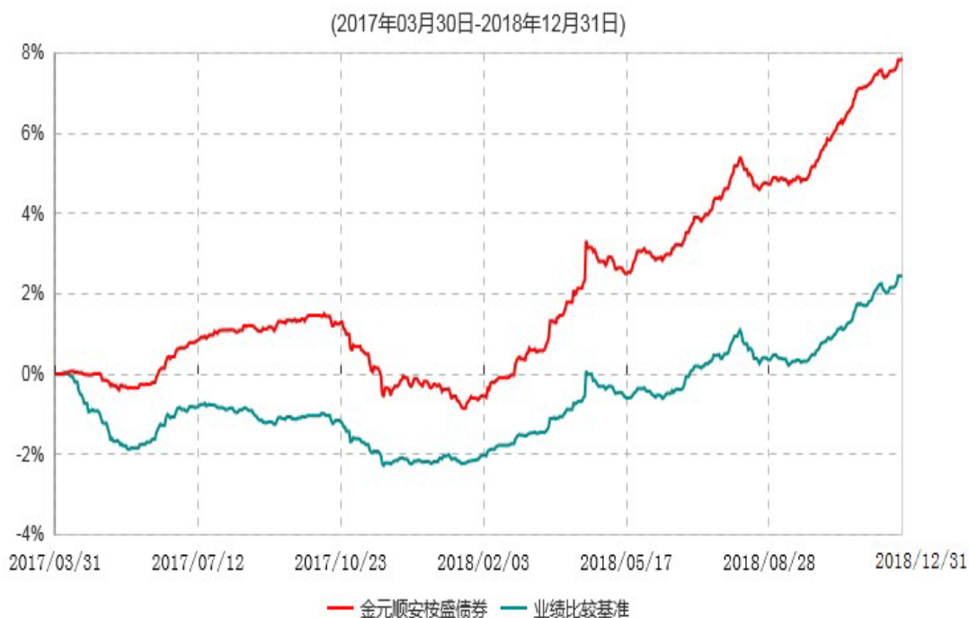
金元顺安桉盛债券型证券投资基金累计净值增长率与业绩比较基准收益率历史走势对比图