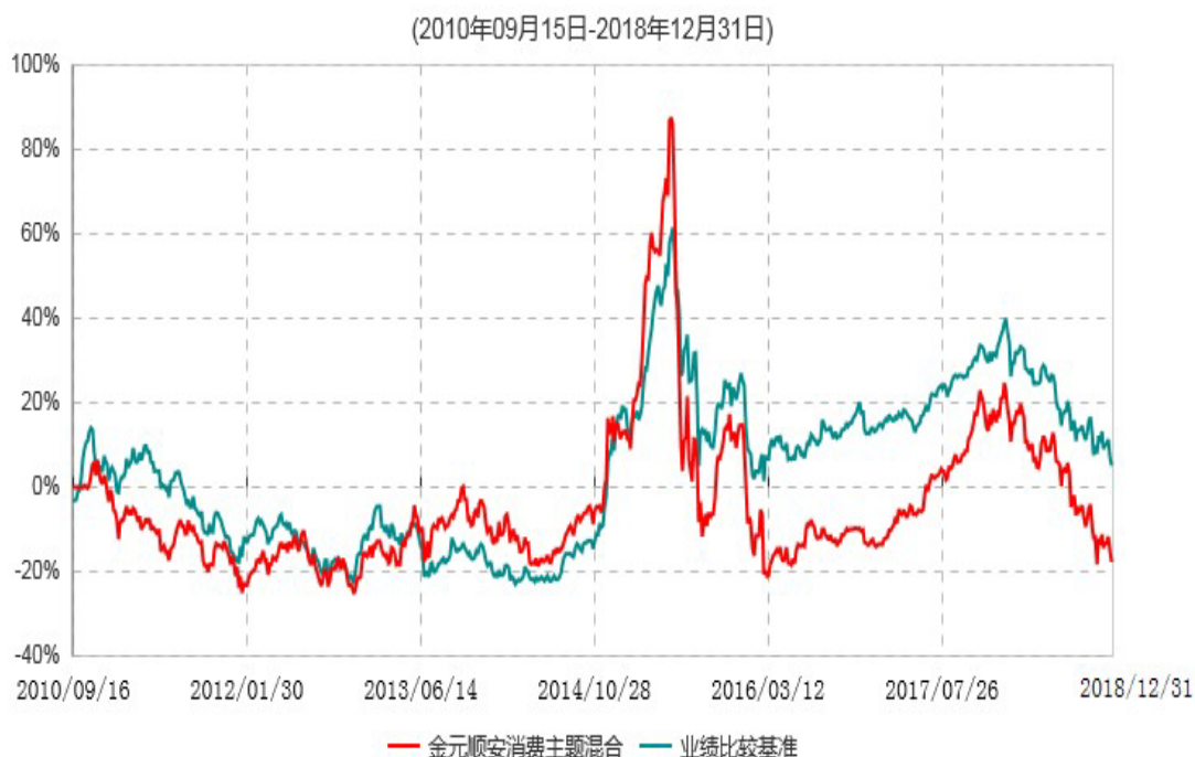
金元顺安消费主题混合型证券投资基金累计净值增长率与业绩比较基准收益率历史走势对比图