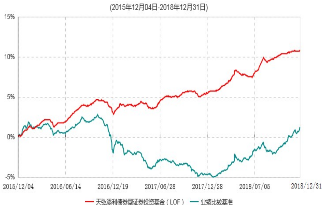
天弘添利债券型证券投资基金（LOF）累计净值增长率与业绩比较基准收益率历史走势对比图

注：1、本基金合同于2010年12月03日生效。根据基金合同约定，本基金于2015年12月03日自动转换为上市开放式基金（LOF），基金名称变更为“天弘添利债券型证券投资基金（LOF）”。