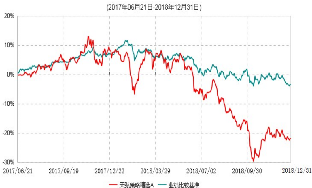
天弘策略精选A累计净值增长率与业绩比较基准收益率历史走势对比图