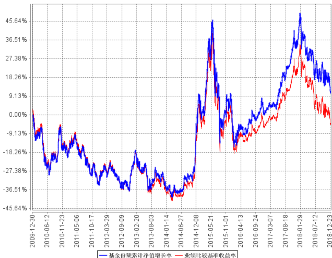
基金份额累计净值增长率与同期业绩比较基准收益率的历史走势对比图

注：根据基金合同的规定，本基金资产投资于具有良好流动性的金融工具，包括中证 100 指数的成份股及其备选成份股、新股、现金或者到期日在一年以内的政府债券等。其中，本基金投资于中证 100 指数的成份股及其备选成份股的比例为基金资产的 90%~95%，基金保留的现金以及投资于到期日在一年以内的政府债券的比例合计不低于基金资产净值的 5%。本基金建仓期为 2009 年 12 月 30 日至 2010 年 6 月 30 日，建仓期结束时各项资产配置比例符合合同约定。