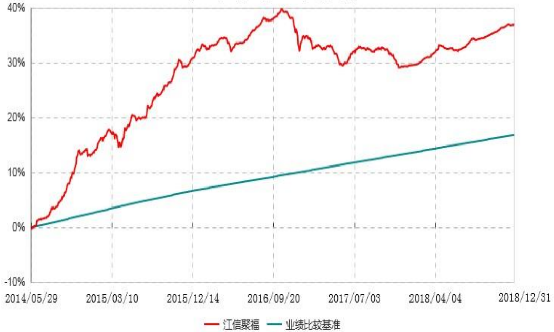
江信聚福定期开放债券型发起式证券投资基金累计净值增长率与业绩比较基准收益率历史走势对比图 (2014年05月29日-2018年12月31日)