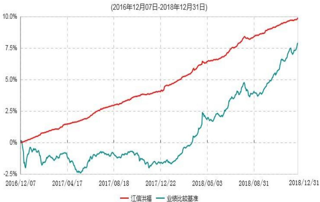
江信洪福纯债债券型证券投资基金累计净值增长率与业绩比较基准收益率历史走势对比图