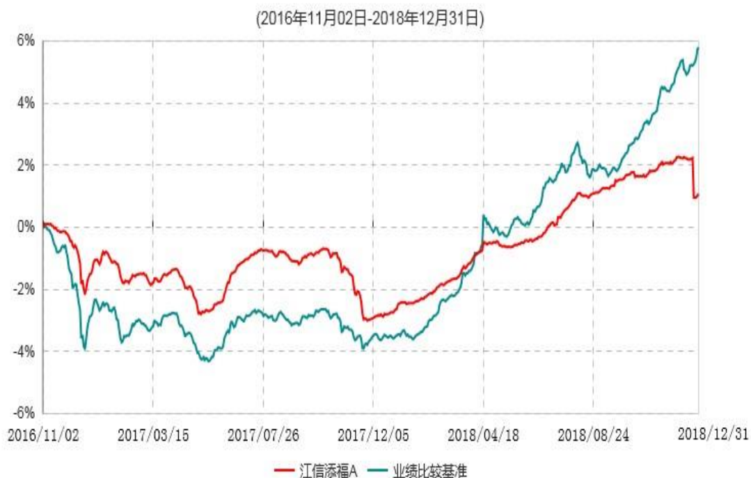
江信添福A累计净值增长率与业绩比较基准收益率历史走势对比图