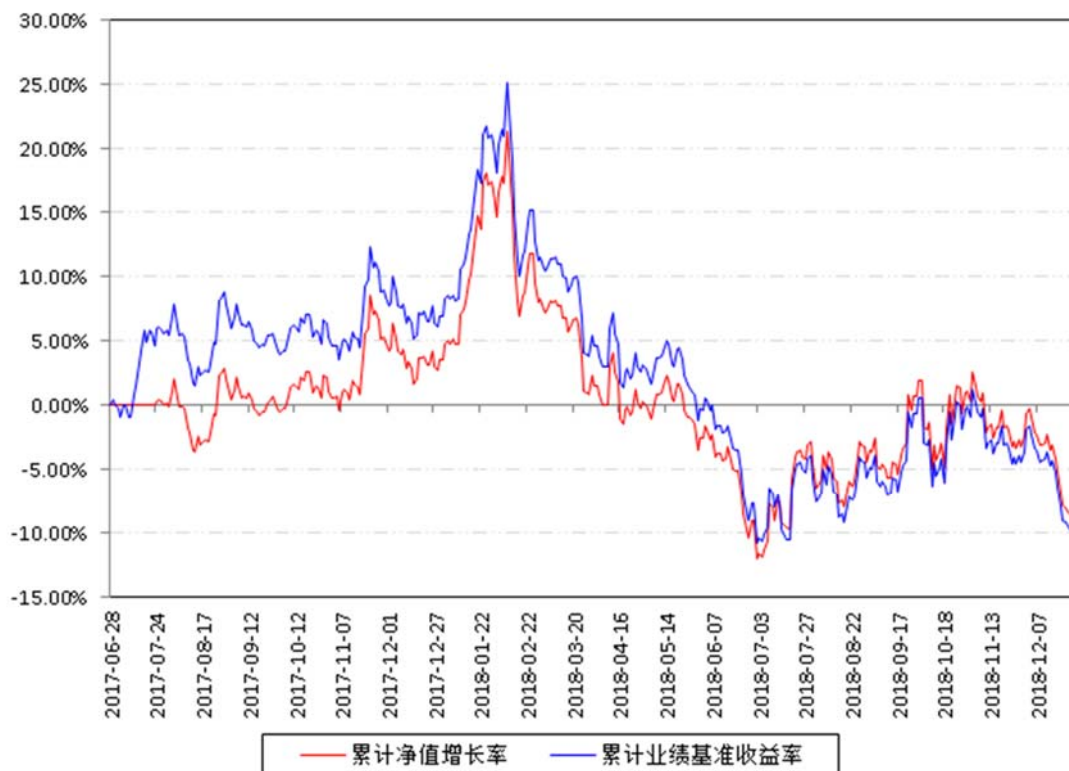
南方中证银行ETF累计净值增长率与同期业绩比较基准收益率的历史走势对比图