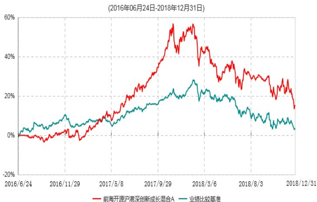
前海开源沪港深创新成长混合A累计净值增长率与业绩比较基准收益率历史走势对比图