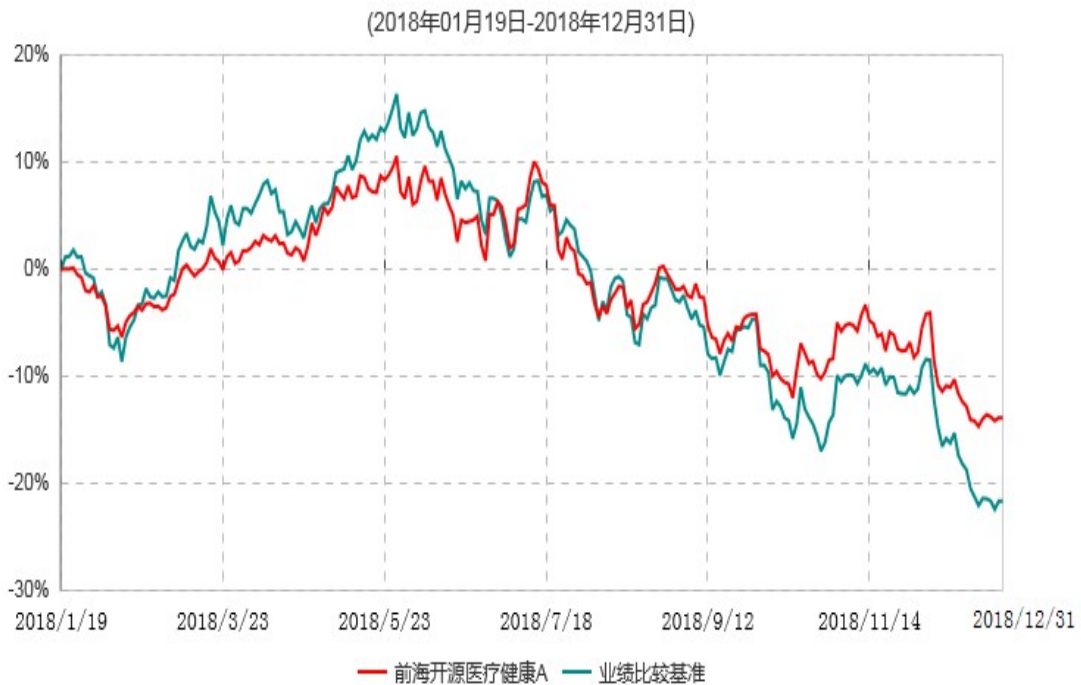
前海开源医疗健康A累计净值增长率与业绩比较基准收益率历史走势对比图