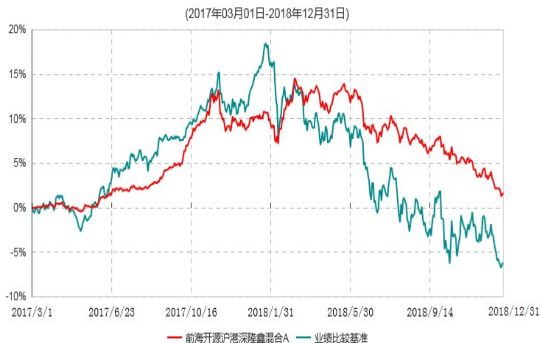
前海开源沪港深隆鑫混合A累计净值增长率与业绩比较基准收益率历史走势对比图