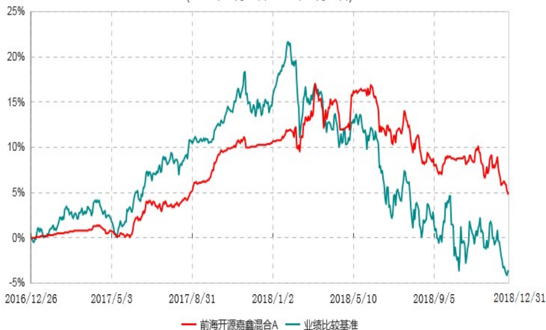
前海开源嘉鑫混合C累计净值增长率与业绩比较基准收益率历史走势对比图