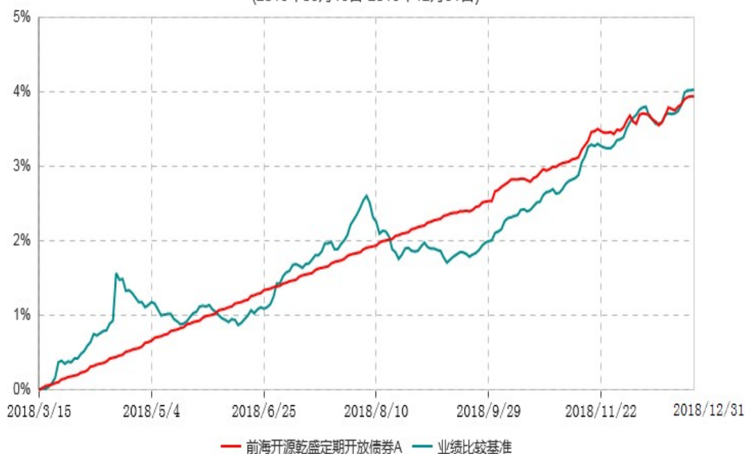
前海开源乾盛定期开放债券C累计净值增长率与业绩比较基准收益率历史走势对比图