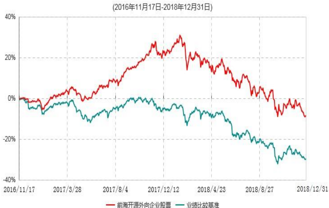
前海开源外向企业股票型证券投资基金累计净值增长率与业绩比较基准收益率历史走势对比图