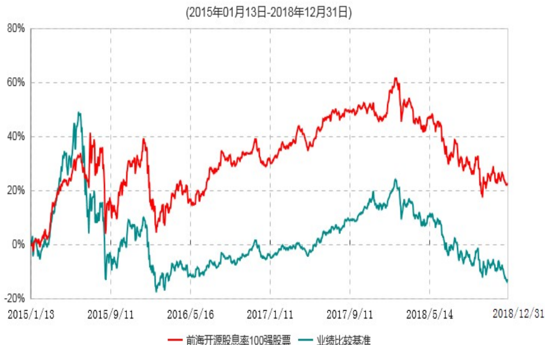
前海开源股息率100强等权重股票型证券投资基金累计净值增长率与业绩比较基准收益率历史走势对比图