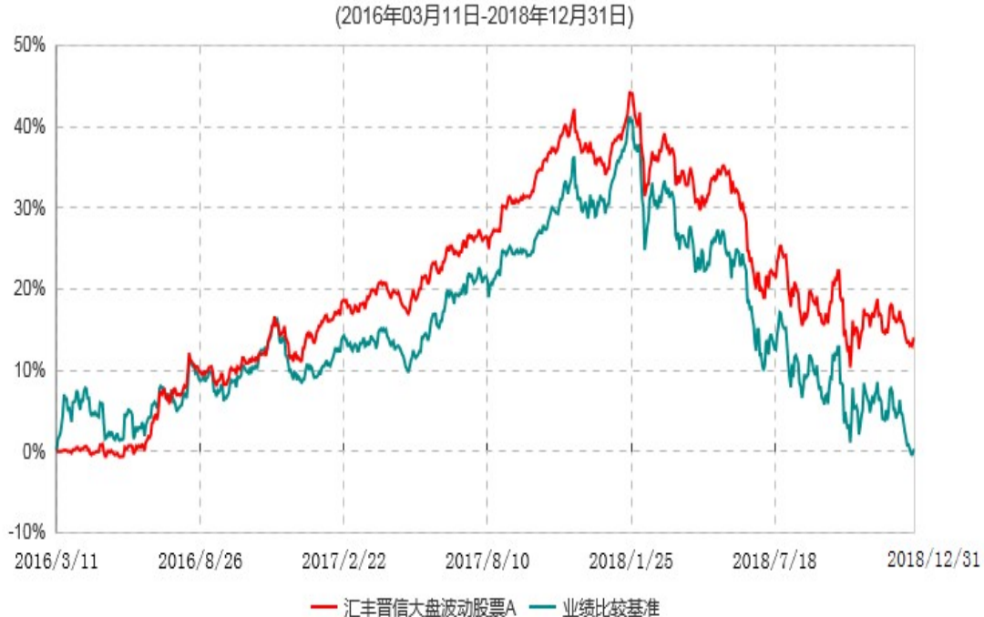
汇丰晋信大盘波动股票A累计净值增长率与业绩比较基准收益率历史走势对比图