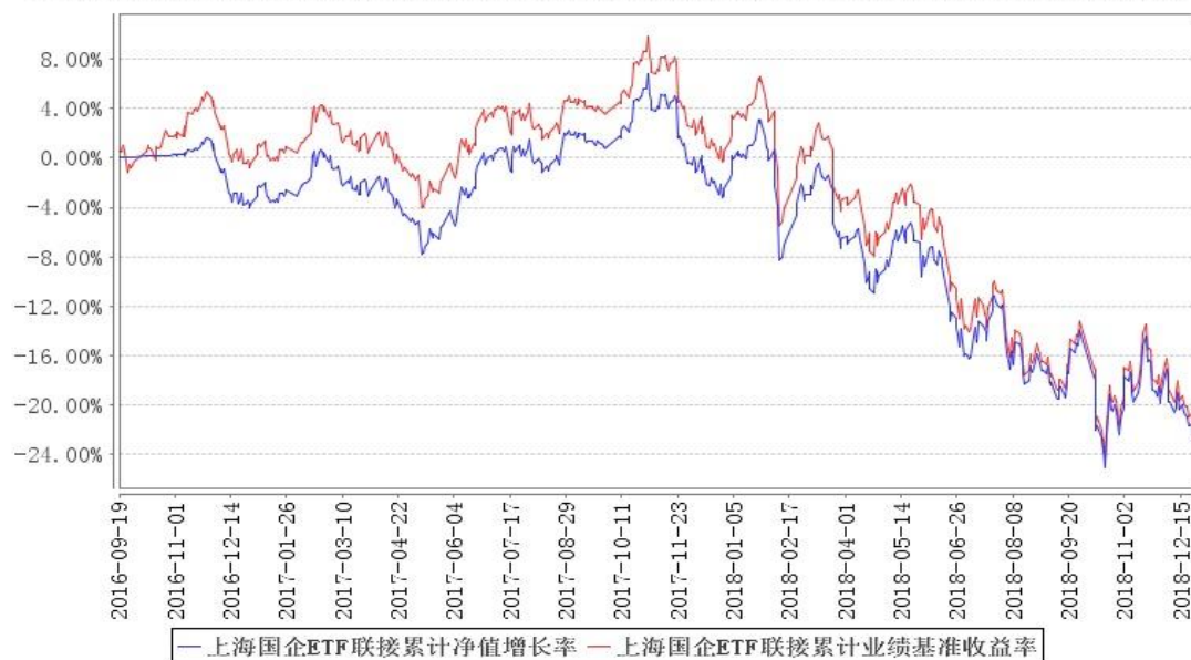
上海国企ETF联接累计净值增长率与同期业绩比较基准收益率的历史走势对比图

注：本基金建仓期为本《基金合同》生效之日（2016年9月18日）起6个月，建仓期结束时各项资产配置比例符合合同规定。