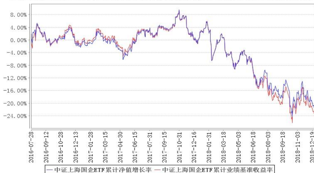
中证上海国企ETF累计净值增长率与同期业绩比较基准收益率的历史走势对比图