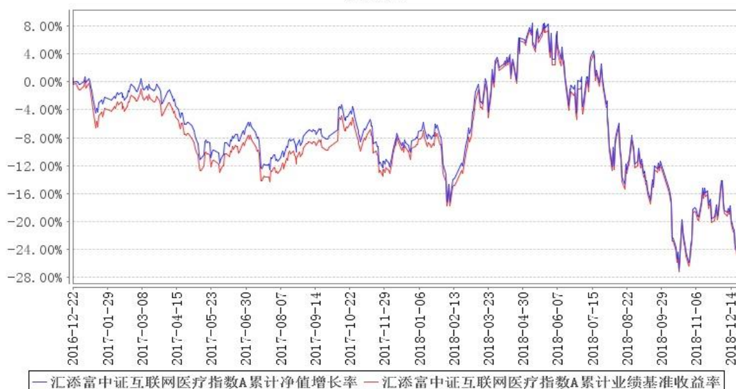
汇添富中证互联网医疗指数A累计净值增长率与同期业绩比较基准收益率的历史走势对比图