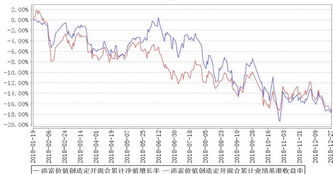
添富价值创造定开混合累计净值增长率与同期业绩比较基准收益率的历史走势对比图

注：本《基金合同》生效之日为 2018 年 1 月 19 日，截至本报告期末，基金成立未满一年；本基金建仓期为本《基金合同》生效之日（2018 年 1 月 19 日）起 6 个月，建仓期结束时各项资产配置比例符合合同规定。