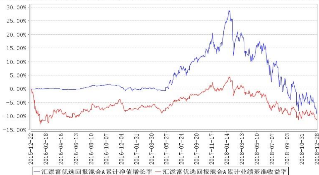
汇添富优选回报混合A累计净值增长率与同期业绩比较基准收益率的历史走势对比图