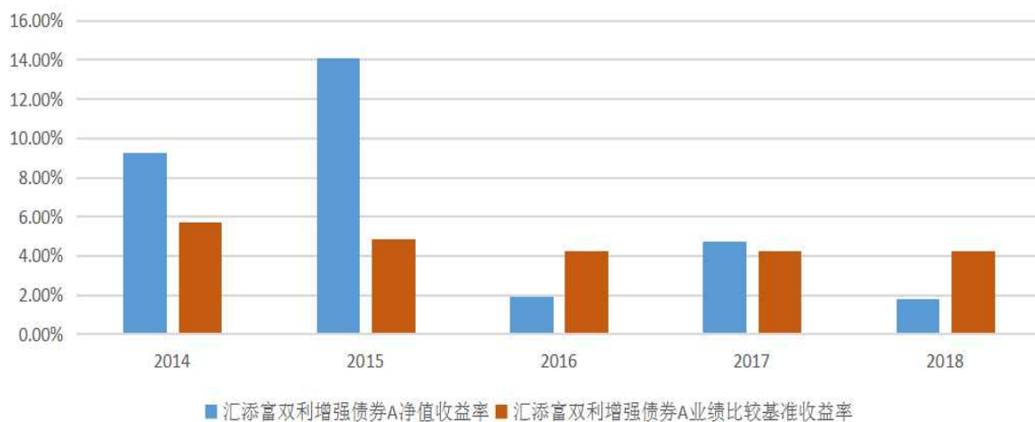
汇添富双利增强债券A基金每年净值增长率与同期业绩比较基准收益率的对比图