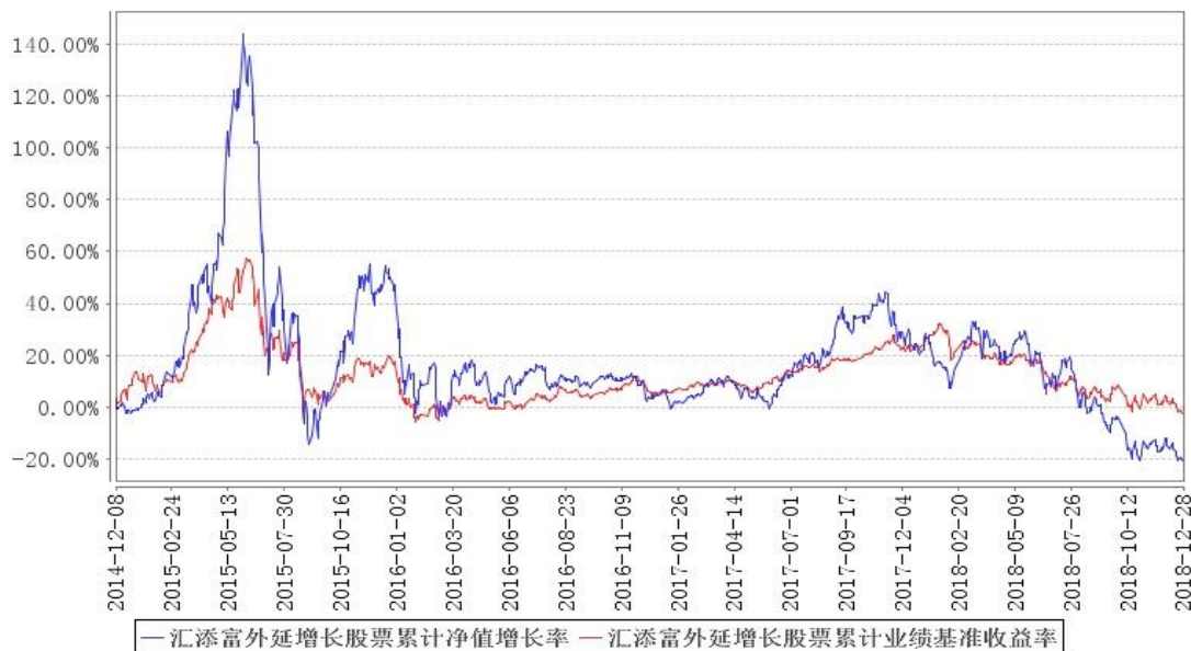
汇添富外延增长股票累计净值增长率与同期业绩比较基准收益率的历史走势对比图

注:本基金建仓期为本《基金合同》生效之日(2014年12月08日)起6个月,建仓期结束时各项资产配置比例符合合同规定。