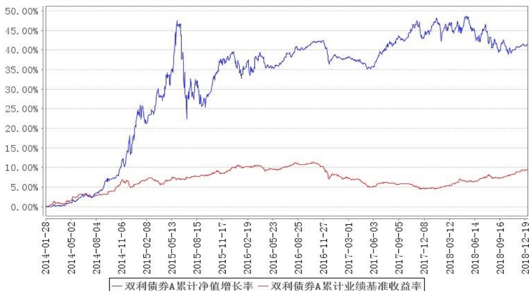
双利债券A累计净值增长率与同期业绩比较基准收益率的历史走势对比图