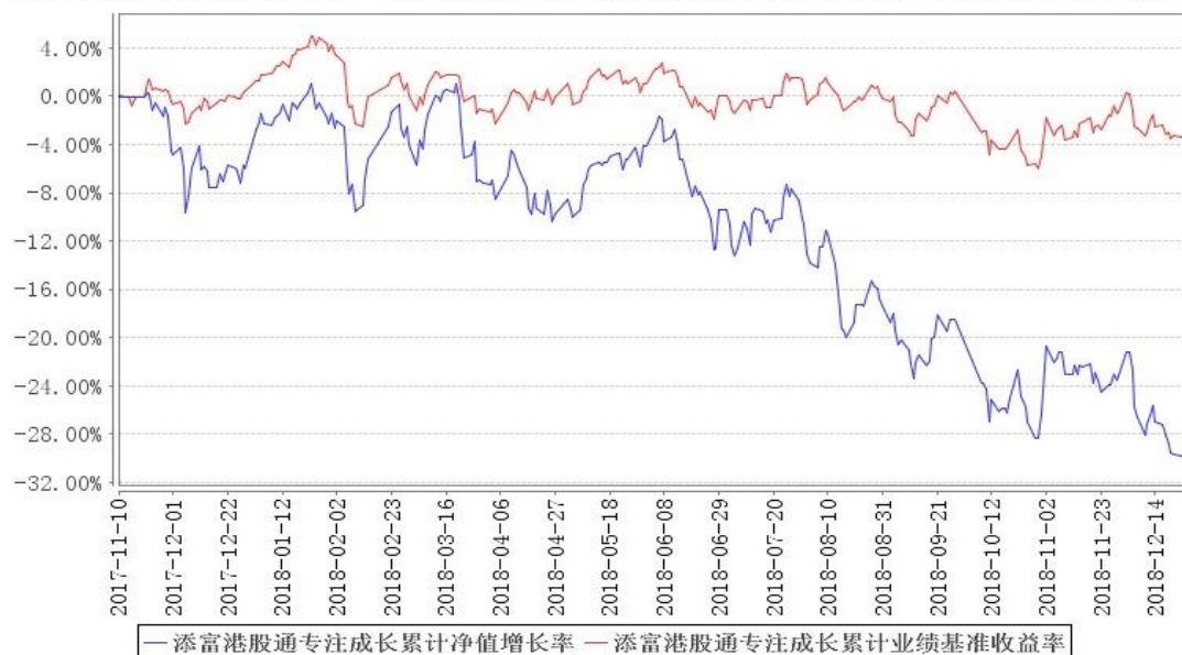
添富港股通专注成长累计净值增长率与同期业绩比较基准收益率的历史走势对比图

注：本基金建仓期为本《基金合同》生效之日（2017年11月10日）起6个月，建仓期结束时各项资产配置比例符合合同规定。