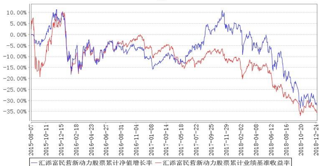
汇添富民营新动力股票累计净值增长率与同期业绩比较基准收益率的历史走势对比图