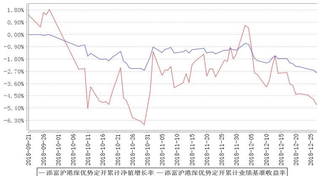
添富沪港深优势定开累计净值增长率与同期业绩比较基准收益率的历史走势对比图

注:本《基金合同》生效之日为 2018 年 9 月 21 日,截至本报告期末,基金成立未满一年;本基金建仓期为本《基金合同》生效之日(2018 年 9 月 21 日)起 6 个月,截止本报告期末,本基金尚处于建仓期中。