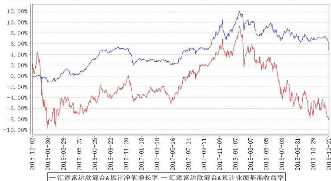
汇添富达欣混合A累计净值增长率与同期业绩比较基准收益率的历史走势对比图